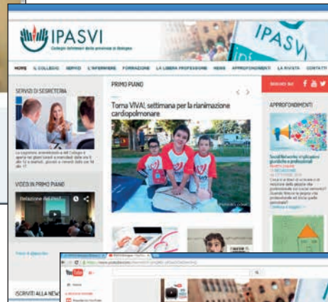
Il nuovo sito internet del Collegio ( www.ipasvibo.it )