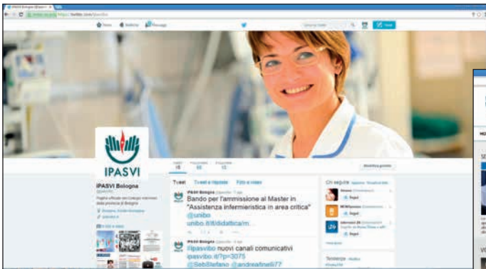
Pagina Twitter @ipasvbo

Le persone interessate a pubblicare articoli, approfondimenti, eventi sui canali comunicativi del Collegio possono inviare il materiale all'indirizzo mail: info@ipasvibo.it